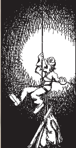
„He! Es hat einen Ruck gegeben! Schau doch mal ob der Spit noch hält.“

Die Erfahrung zeigt leider, dass die tragischen Unfälle meist durch eine Verkettung unglücklicher Umstände und Fehleinschätzungen entstehen, die für sich allein genommen oft nicht einmal gravierend sind, deren Zusammenspiel aber dramatische Konsequenzen haben kann.